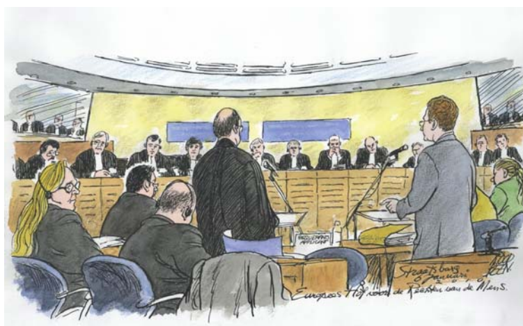
Beeld van de zitting van het Hof in Straatsburg op 6 januari 2010. Tekening van Chris Roodbeen in De Telegraaf d.d. 7 januari 2010.

Vindplaats: EHRM 31 maart 2009, appl. no. 38224/03 , op < www.echr.coe.int/echr/homepage_en >; zie ook: NJB 2009, p. 1453-1454 (bron voor deze vertaling); NJ 2009, 450 m.nt. E.J. Dommering, Mediaforum 2009/5, nr. 17 (p. 222-228) en een artikel van A.W. Hins over deze uitspraak (p. 202-206).